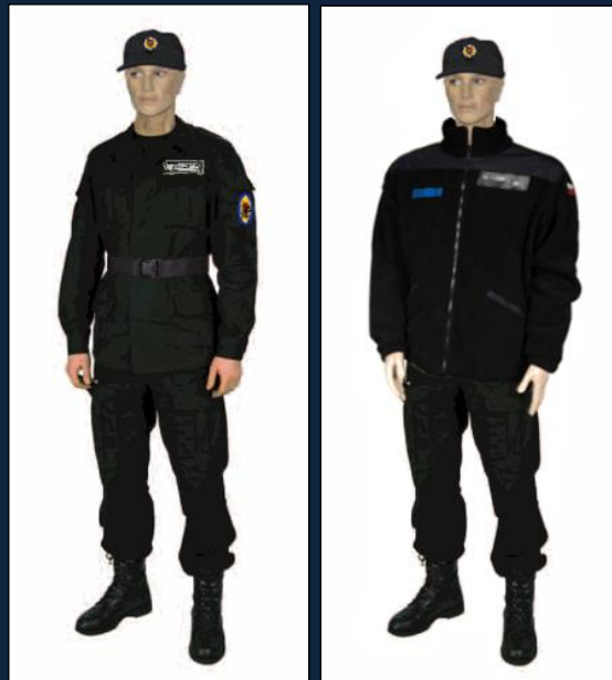
MUNDURY POLICYJNE I POŻARNICZE

Uzupełnieniem tych zestawów jest noszona, jako podkład pod mundur dowolna, koszulka T-shirt w kolorze: khaki – klasa wojskowa, czarnym – klasa policyjna, pożarnicza.